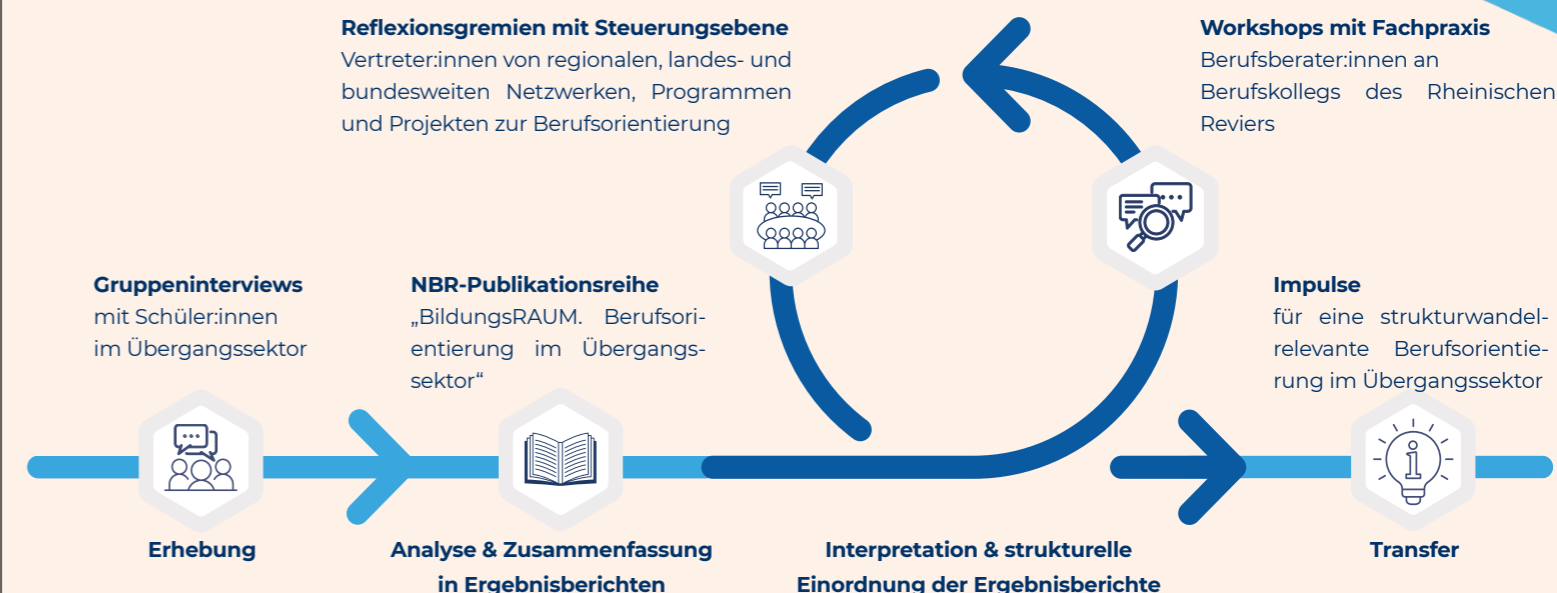
Abbildung 1: Entwicklungsprozess der Impulse für eine strukturwandelrelevante Weiterentwicklung der Berufsorientierung im Übergangssektor. Eigene Darstellung.

Zielgruppenspezifische Inhalte und Formate (Holmgaard/Knüttel 2025c)