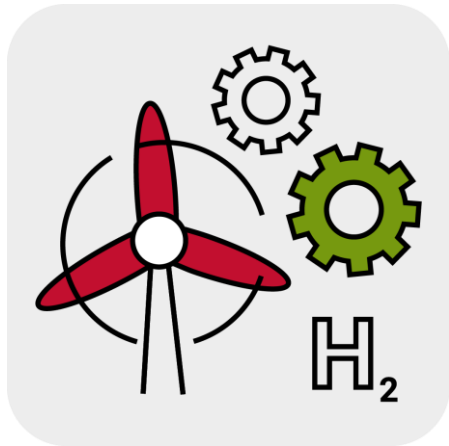
Energie und Industrie